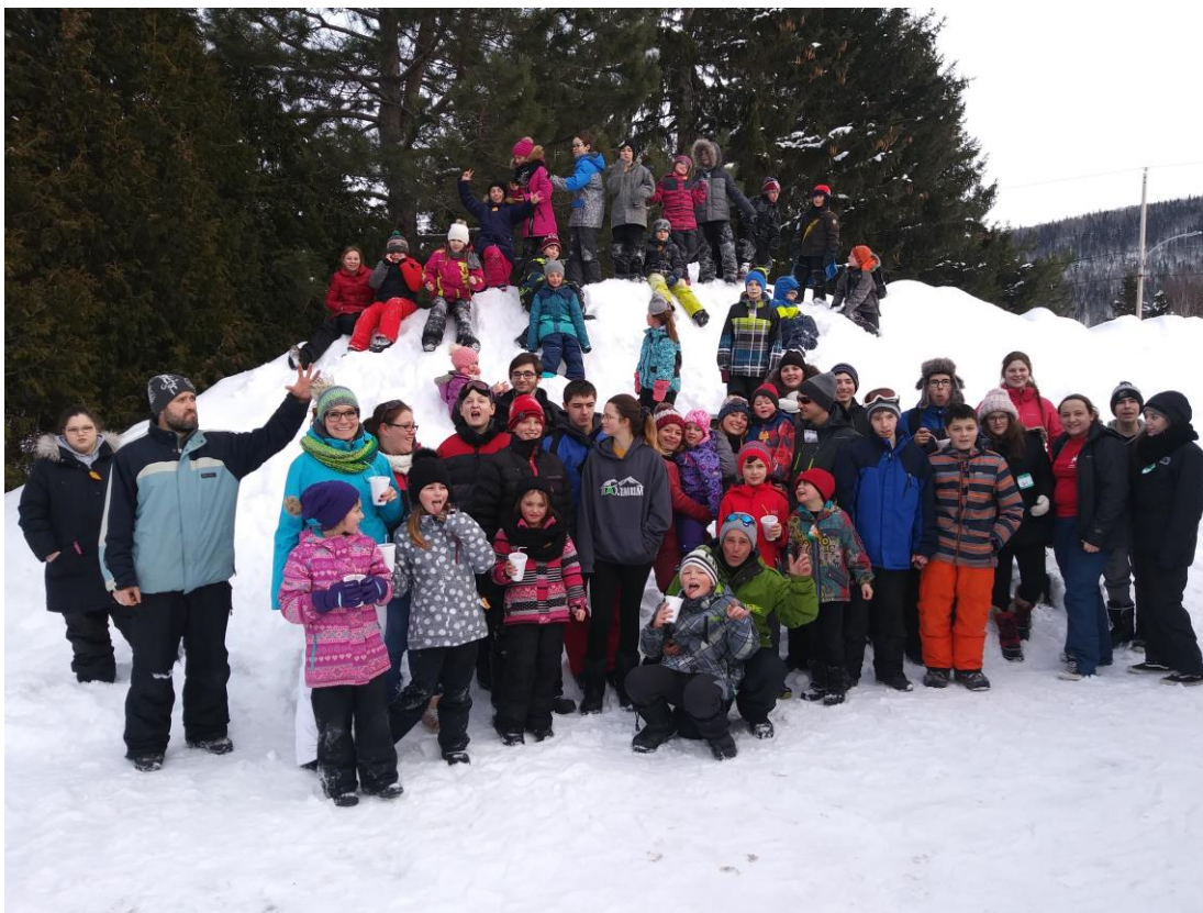
planche à neige étaient aussi gratuits pour les jeunes. Nous remercions chaleureusement les donateurs, les partenaires, les bénévoles et les animateurs pour ces merveilleuses journées plein air. Nous avons eu du beau temps et énormément de plaisir.